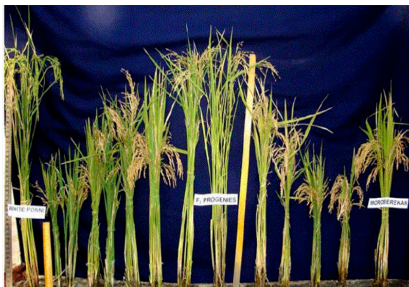
Fig. 2. Variabilità nella progenie di un incrocio tra due varietà di riso. Alle due estremità i genitori usati per l'incrocio. Immagine di I. Selvaraj, Vellore University (India).

L'ibridazione tra specie diverse ma sessualmente compatibili è prevalentemente utilizzata per trasferire dalla specie donatrice, per lo più una specie selvatica, alcuni geni e le corrispondenti caratteristiche assenti nella specie coltivata (es. resistenza a insetti o migliore qualità). L'incrocio però rimescola tutti i geni dei due genitori. Quando si desidera ottenere nuove varietà stabili bisogna perciò "ripulire" la pianta dai geni indesiderati che sono stati ereditati insieme a quelli desiderati, specialmente quando uno dei genitori è una pianta selvatica che è inadatta alla coltivazione. A questo scopo, per diverse generazioni si realizzano successivi re-incroci con il genitore coltivato, in modo da eliminare quanto più possibile i geni "selvatici". Il risultato finale sarà quindi una pianta quasi identica alla pianta iniziale, che conterrà poche decine o centinaia di geni della pianta donatrice, tra cui ovviamente quello o quelli che conferiscono la caratteristica desiderata, e manterrà nel contempo tutte o la maggior parte delle proprie caratteristiche positive. Questa procedura è definita "introgressione tramite re-incrocio" ed è ad esempio largamente utilizzata per introdurre nuovi geni di resistenza ad agenti patogeni individuati in piante selvatiche o meno addomesticate.