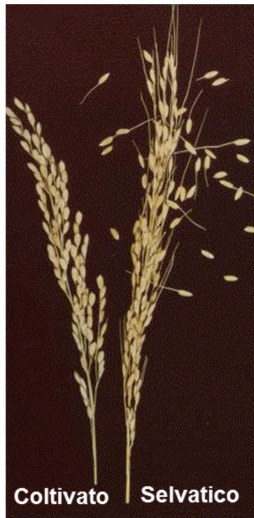
Fig. 1. Riso coltivato e selvatico

La cosiddetta "sindrome da domesticazione" è quindi il risultato dell'accumulo di una o più mutazioni nel DNA, che si traducono nell'alterazione dell'espressione di specifici geni o della loro funzionalità. Tutte le piante coltivate sono quindi organismi geneticamente modificati rispetto alle piante selvatiche da cui derivano, e tale modifica è intrinseca all'agricoltura. Non ha dunque senso giudicare a priori come pericolosa o negativa una modifica genetica, bensì è il suo effetto (la pianta risultante) che va analizzato e valutato.